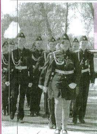
О ДНИМ из значимых направлений деятельности Аргаяшского районного совета ветеранов Челябинской области является сотрудничество с местным кадетским корпусом, обра-